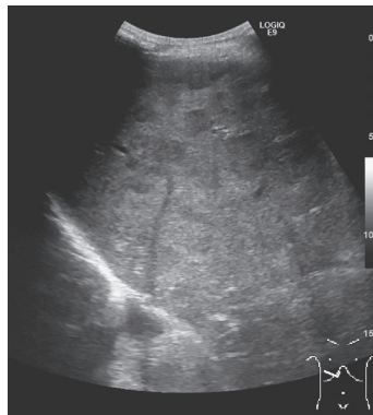
Figure 1. 腹部超音波画像。