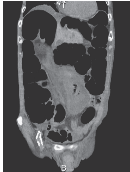
Figure 2. 腹部単純CT.