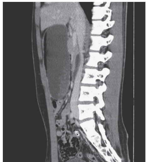
Figure 2. 腹部造影CT 矢状断。