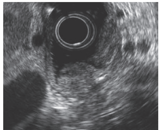
Figure 2. 超音波内視鏡検査.